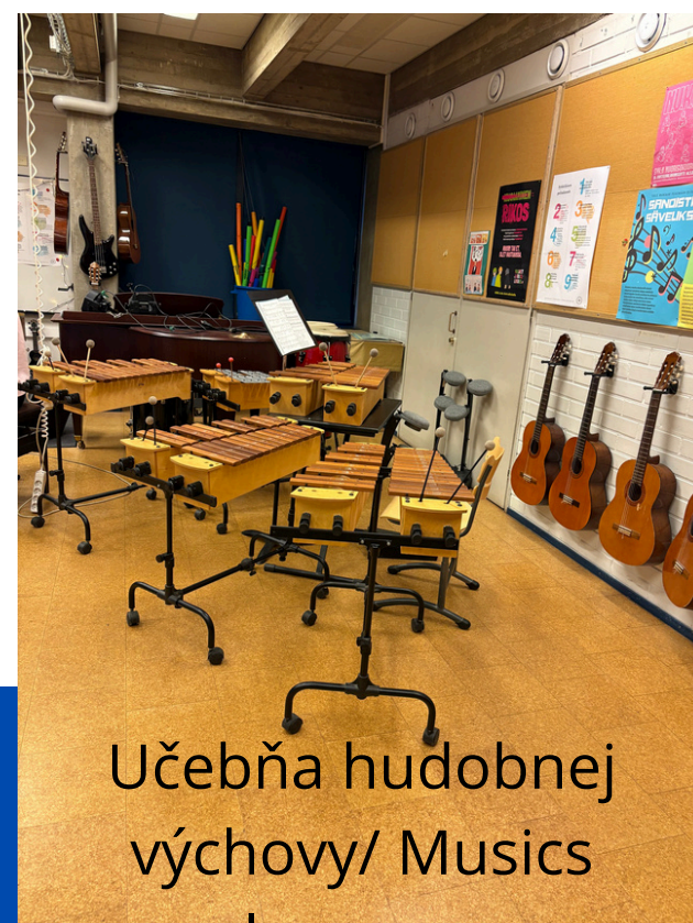
Učebňa hudobnej výchovy/ Musics classroom