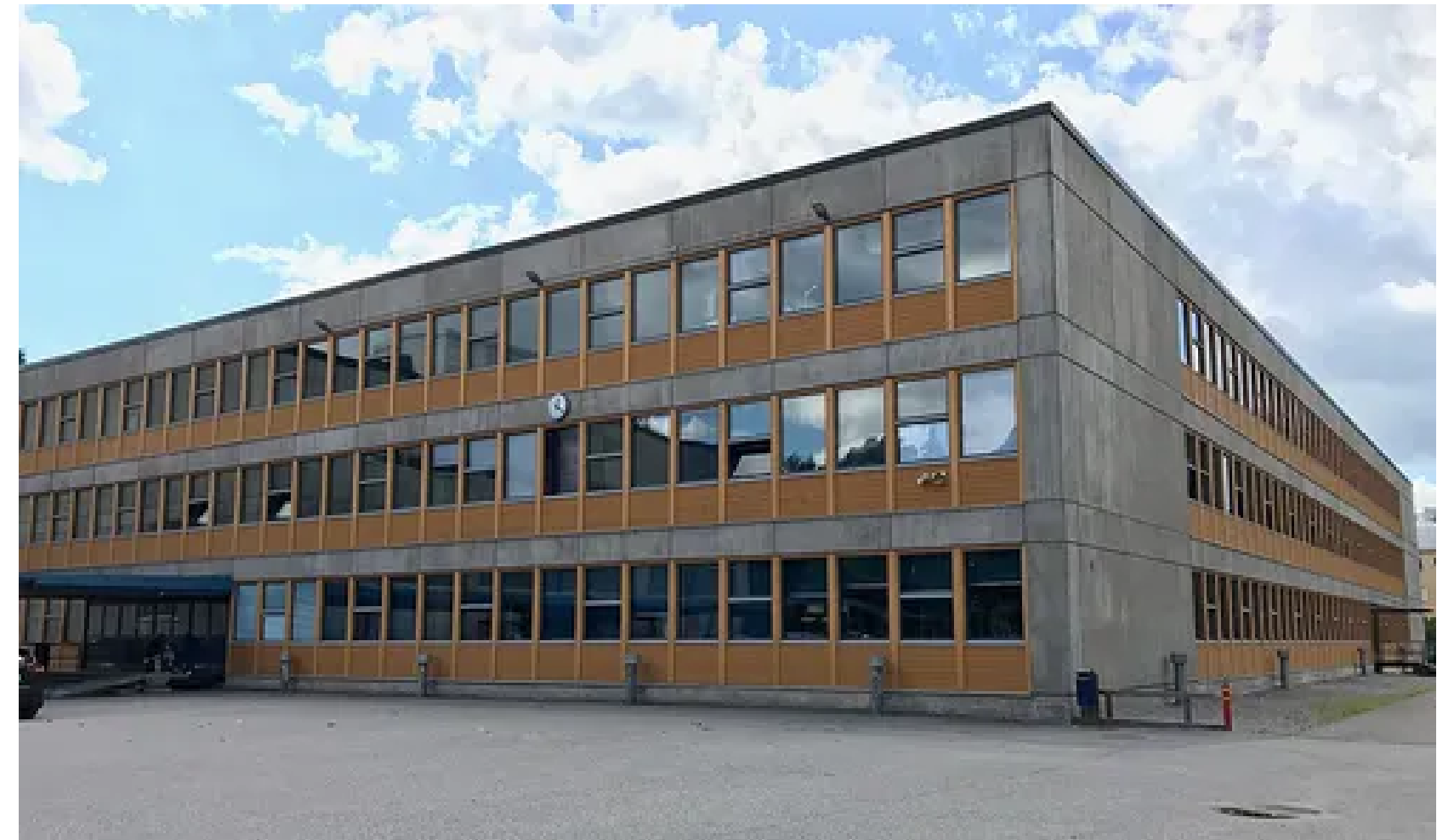
Helsingin Suomalainen Yhteiskoulu, Isonnenvantie 8, Helsinki