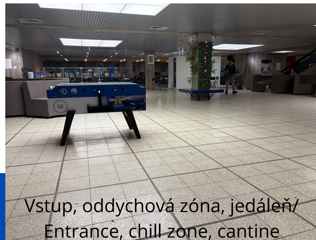
Vstup, oddychová zóna, jedáleň/ Entrance, chill zone, cantine