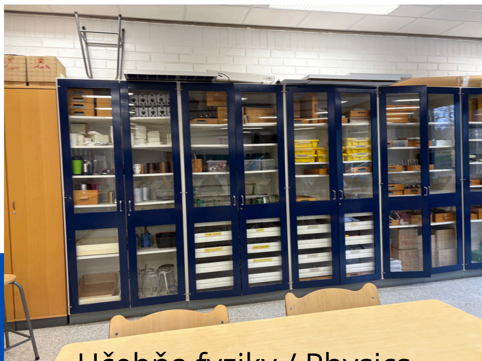
Učebňa fyziky / Physics classroom