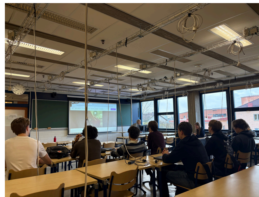
Ekonomía IB Diploma