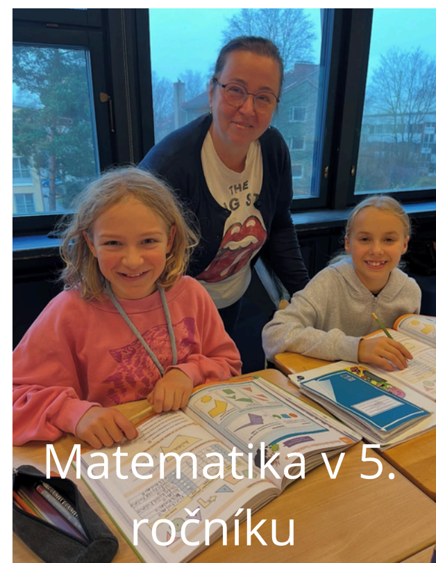
Matematika v 5. ročníku